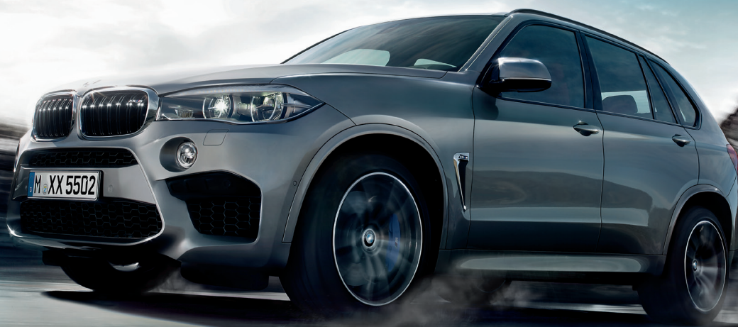
Imagen únicamente ilustrativa.